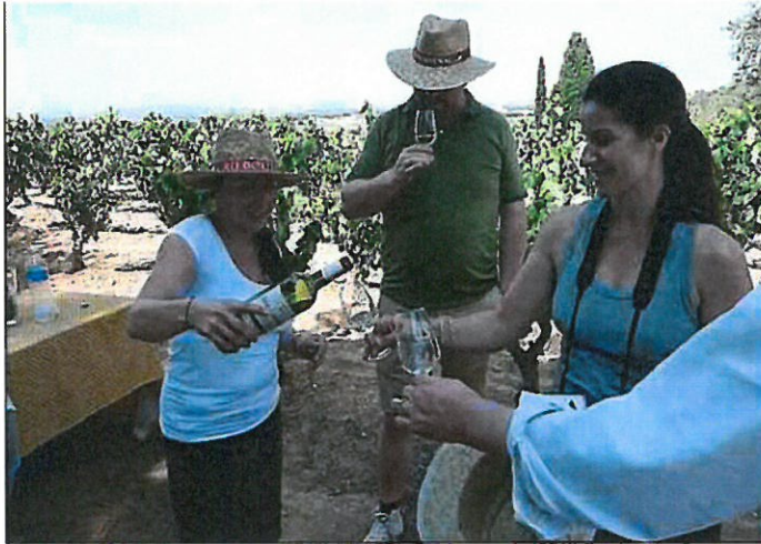
► En chemin, une halte en compagnie d'une vigneronne.

L'AOC Corbières Boutenac représente 25 producteurs dont 4 caves coopératives et 21 caves particulières . Les vins, vin rouge sec exclusivement, sont issus des cépages carignan, syrah, grenache et mourvèdre. Les 10 ans du cru étaient l'occasion de revenir sur l'évolution de l'appellation grâce à une dégustation verticale des millésimes 2005 à 2013 des différents domaines mettant en valeur l'une des caractéristiques du cru sur la fraîcheur des vins, mais aussi de voir plus loin. Prochaine étape, l'appellation communale avec un travail qui va s'engager dès cet automne pour devenir AOC Boutenac . Un nouveau dossier porté le président Pierre Bories qui saluait l'engagement de tous les vigneronnes autour de cette démarche commune et aussi l'arrivée d'une nouvelle génération de vigneronnes et vigneronnes qui ont à cœur de défendre leur identité tout en apportant leur propre créativité dans l'élaboration de leurs vins. Il rappelait également que les 10 ans passés ont été marqués par la crise viticole depuis 2003 qui a fortement touché les Corbières.