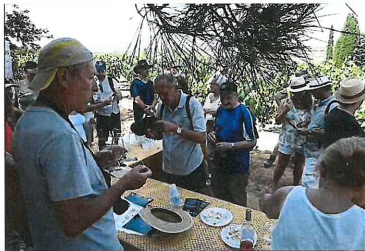
► Des petits chèvres sous les pins pour reprendre des forces.