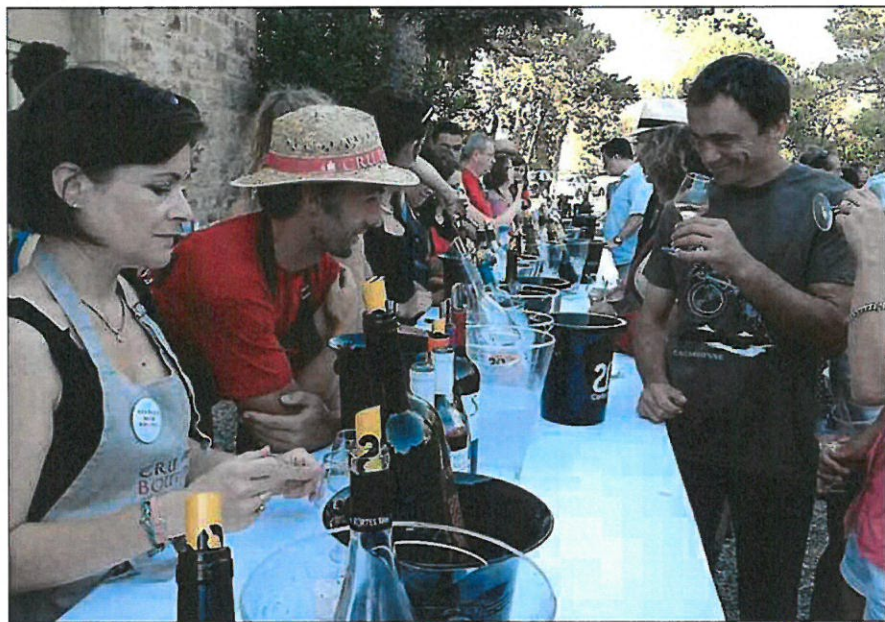
Au château de Boutenac, les marcheurs découvraient à l'arrivée l'ensemble des vigneron. C L

En chemin, quelques haltes ombragées présentant les vins de plusieurs domaines et des spécialités bienvenues, petits chèvres de pro-